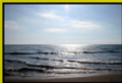
Spiaggia di Alberese